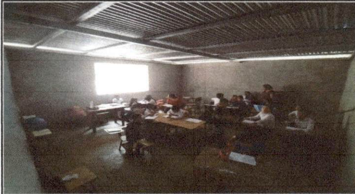
Foto1: Trabajo terminado DE SUSTICIÓN DE PISO CONCRETO