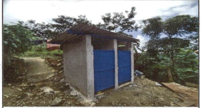
Foto 2: trabajo terminado DE SUSTICIÓN DE LAMINA POR LAMINA TROQUELADA, REPELLO MURO, SUSTITUCIÓN DE ELEMENTOS DE FIJACION , SUSTITUCIÓN DE ESTRUCTUTRA DE SOPORTE DE MADERA